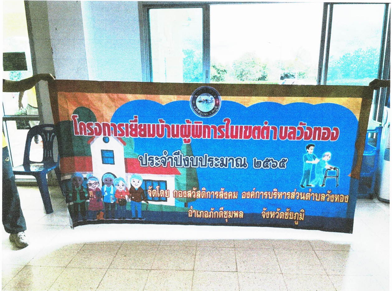
ภาพป้ายโครงการเยี่ยมบ้านผู้พิการในเขตตำบลวังทอง